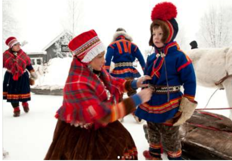
6 de febrero. Día Nacional Comunidad Sami