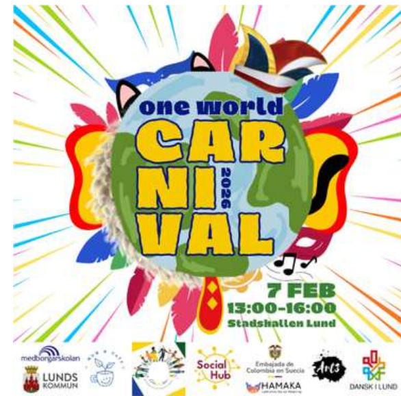
7 de febrero. One World Carnavil -Lund