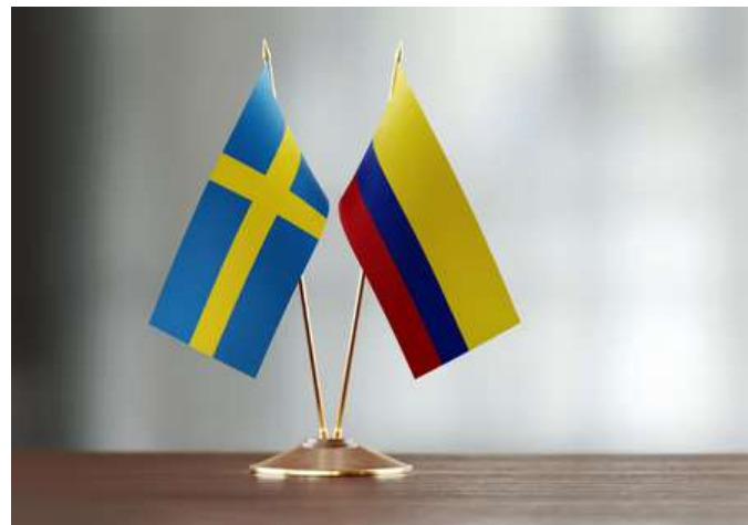
9 de febrero. Posesión de la Consúl Honoraria de Colombia en Malmo