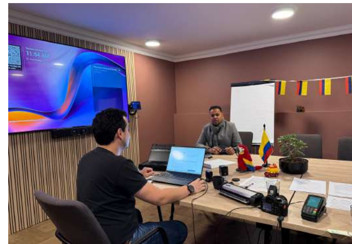
20 de febrero. Consulado Móvil en Malmo