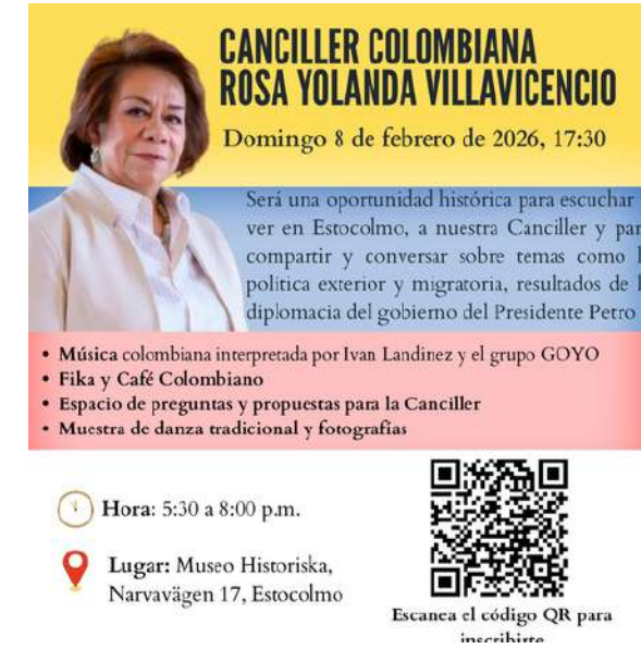
8 de febrero. Conversatorio con la Canciller Rosa Villavicencio