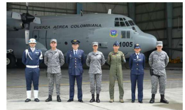
26-27 de febrero. Visita del comandante de la fuerza Aeroespacial de Colombia