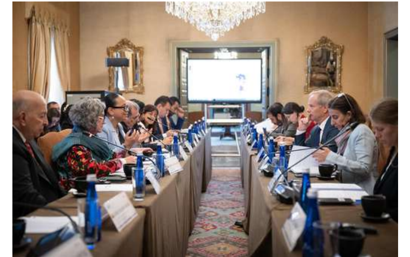
9 de febrero. Diálogo de alto nivel: Cancilleres de Suecia-Colombia Consultas Políticas entre el Gobierno de Colombia y Suecia