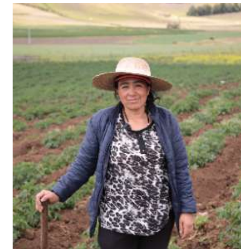
24 al 28 de febrero. II Conferencia internacional de Reforma Agraria